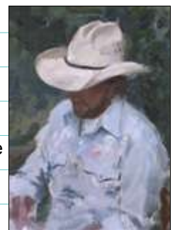
(Continued on page 5)

In Language Arts, the new theme is American